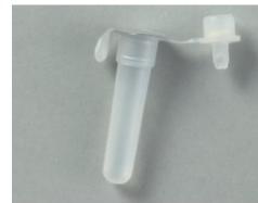
抽出管(希釈液入り)